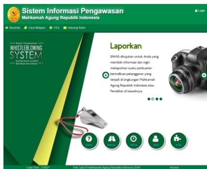
Gambar Aplikasi SIWAS Mahkamah Agung RI

Identitas Anda Sebagai Pelapor AMAN DAN DIRAHASIKAN