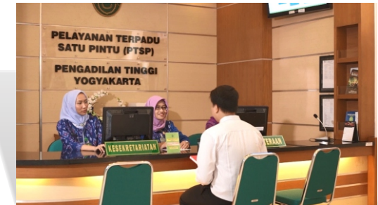
Gambar Pelayanan Terpadu Satu Pintu Pengadilan Tinggi Yogyakarta